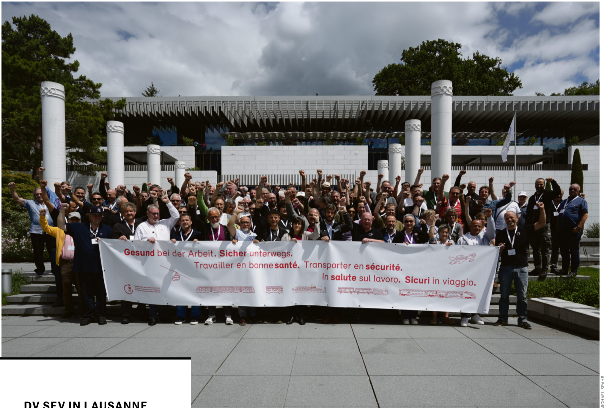
DV SEV IN LAUSANNE

Die Zeitung der Gewerkschaft des Verkehrspersonals