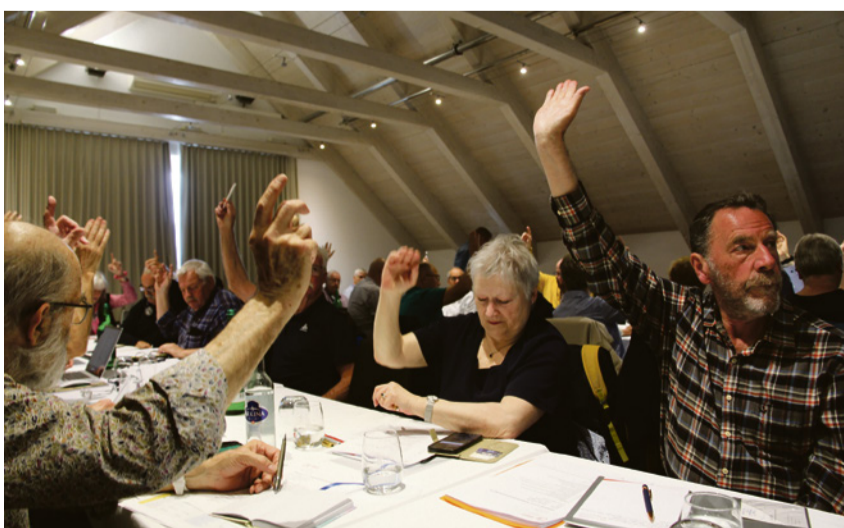
Abstimmung an der 111. Delegiertenversammlung in Sargans.