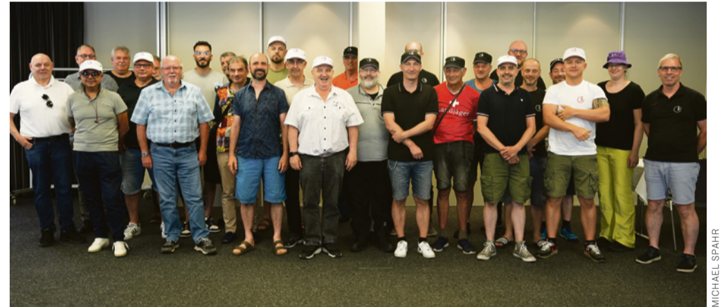
Stark und verbunden: Die Delegierten des TS im Hotel Olten.