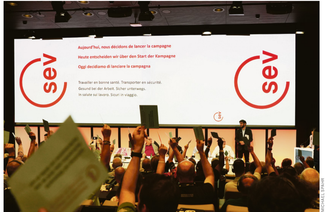
Einstimmig sagen die Delegierten Ja zu einer Kampagne für einen besseren Gesundheitsschutz.

Irina Guseva Canu, Professorin an der Universität in Lausanne und verantwortlich für die Trapheac-Studie zur Gesundheit der Busfahrer:innen, gibt einen Einblick in die neueste Studie, die zeigt, dass mehr als die Hälfte der 748 befragten Busfahrer:innen unter Gelenkschmerzen leidet. Ein Viertel der Befragten leidet unter starkem Stress am Arbeitsplatz, wobei die Hälfte davon ein hohes Burnout-Risiko aufweist. Die Resultate der Studie werden in den nächsten Monaten im Detail veröffentlicht. Im September 2026 können sich Busfahrer:innen für die Teilnahme an der Fortsetzung der Studie anmelden. «Es freut mich, euch mit unserer wissenschaftlichen Arbeit bei der gewerkschaftlichen Arbeit zu unterstützen», sagt Irina Guseva Canu.