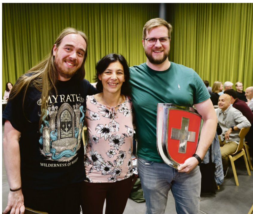
Die zwei neuen Co-Zentralpräsidenten und die abtretende Zentralpräsidentin.