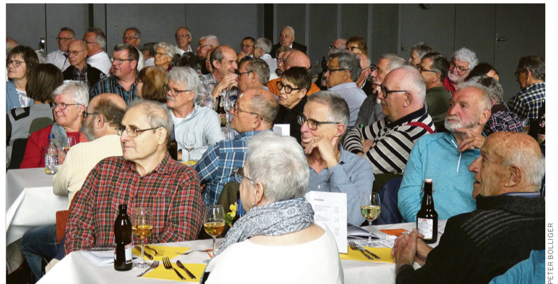
Die Jubiläumsversammlung des PV Olten fand grossen Zuspruch.