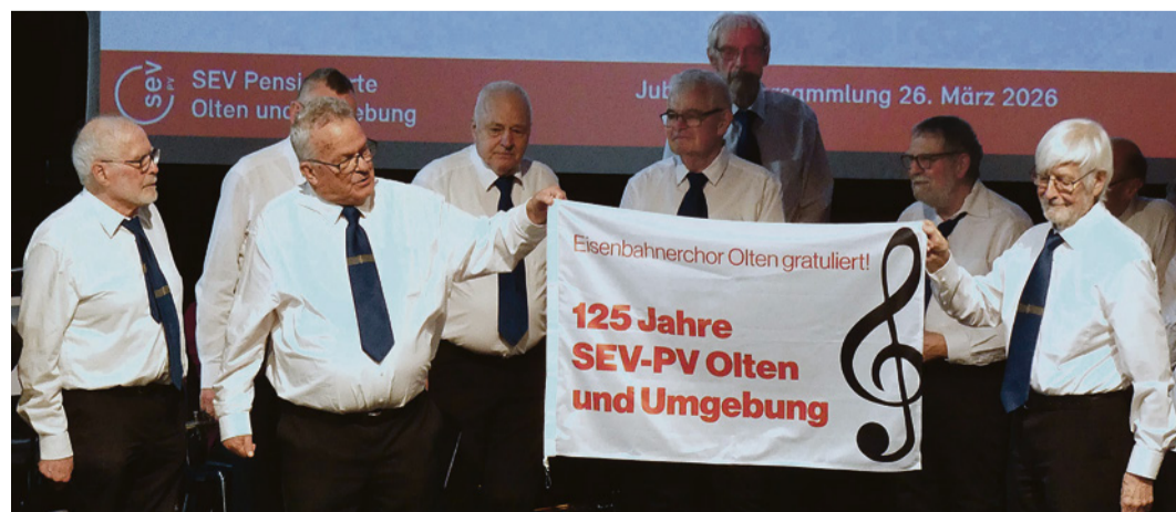
Der Eisenbahnerchor gratulierte mit Gesang und einer besonderen Fahne.