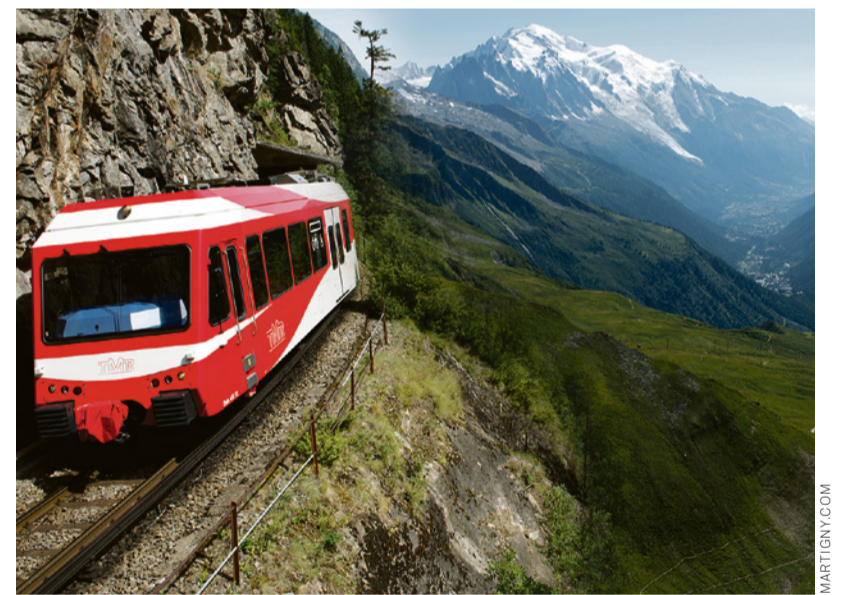
Le Mont-Blanc Express des TMR relie Martigny à Chamonix.