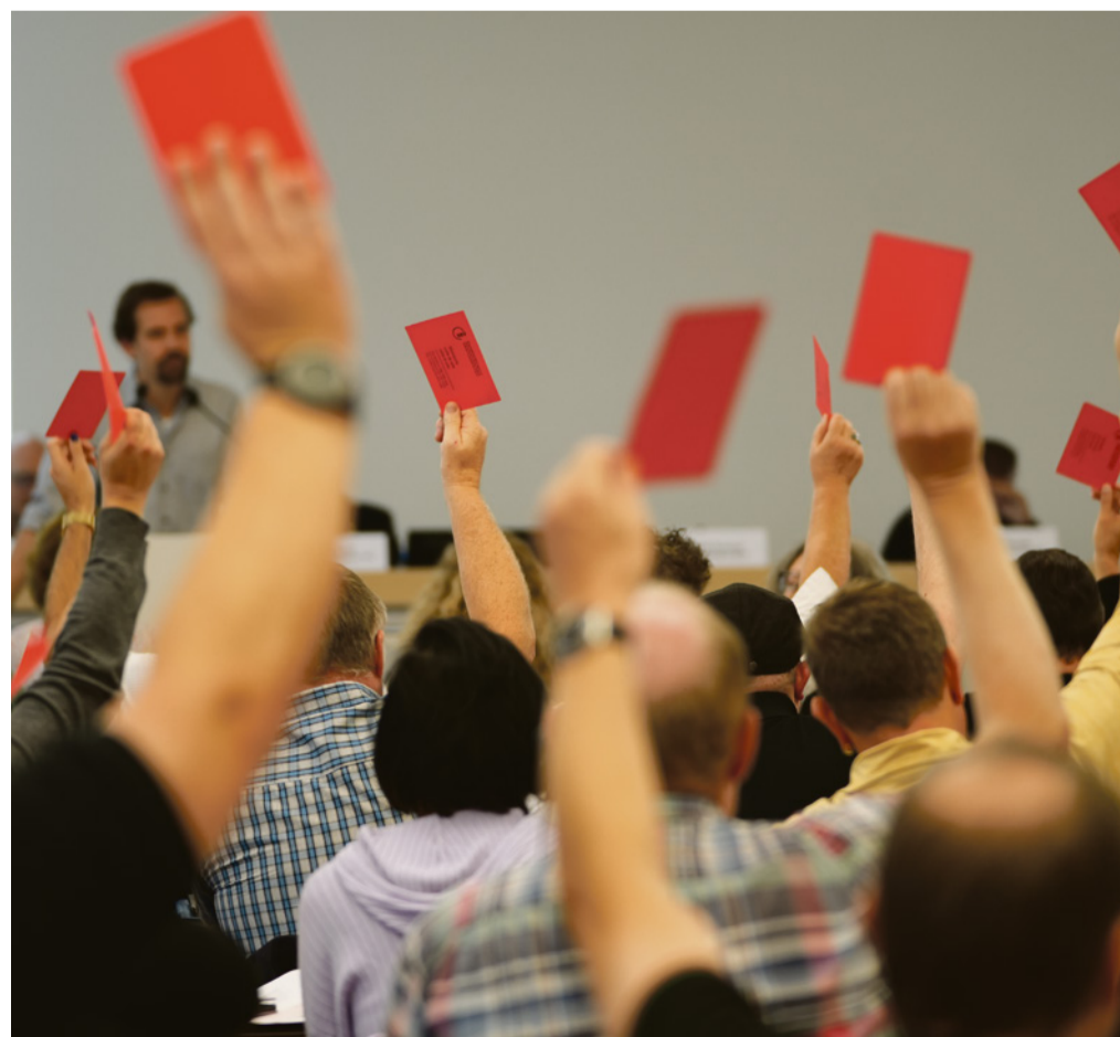
Décision unanime : les BAR doivent rester partie intégrante de la CCT.

Le 28 octobre, un large comité de partis, de syndicats (dont le SEV) et d'autres organisations a déposé l'initiative « Un salaire pour vivre. Pour un salaire minimum en ville de Berne ». Malgré une perte intermédiaire de 1600 signatures à la chancellerie municipale, le comité a finalement pu déposer plus de 7400 signatures grâce à une large solidarité au sein de la population. Le salaire minimum doit s'élever à 23,80 francs et contribuer à lutter contre la pauvreté. En vigueur à Neuchâtel en 2017 (20 francs), Jura en 2018 (20), Genève en 2020 (23 puis 24), des initiatives sont en cours dans différents cantons (VD, VS, FR notamment) et villes (Bienne) pour réclamer un salaire minimum légal.