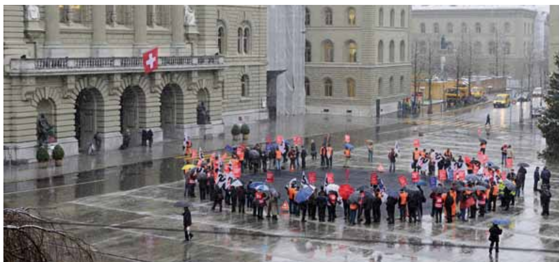
Membri SEV esprimono il loro malcontento per il «buco della cassa pensione» sulla Piazza federale.

Il personale ha dovuto ingoiare altri rospi, come l'aumento del contributo di risanamento e l'innalzamento dell'età di pensionamento a 65 anni; rospi resi un po' meno indigesti da una leggera riduzione dei contributi ordinari alla cassa.