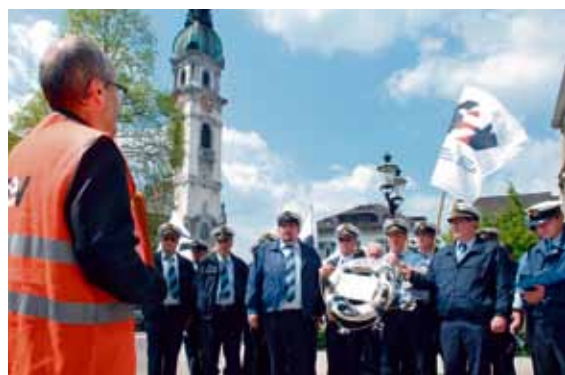
Il personale della navigazione sul lago Bodanico protesta contro i piani di smantellamento

C'era una volta la Società di navigazione sul lago Bodanico, che apparteneva alle FFS. Da sempre ha rappresentato un problema per la casa madre ed è rimasta un problema anche dopo essere stata venduta. Nell'aprile del 2009 ecco una nuova gestione, con il chiaro compito di realizzare una radicale ristrutturazione. Licenziamenti, taglio delle retribuzioni, orari di lavoro più lunghi e chiusura delle porte al sindacato: questa la ricetta.