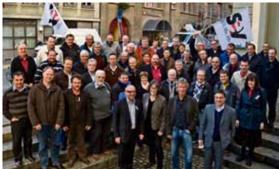
L'ex-comitato federativo (fino a 2009)

Le modifiche delle strutture dirigenziali del SEV approvate all'ultimo congresso hanno comportato anche dei cambiamenti nella composizione degli organi.