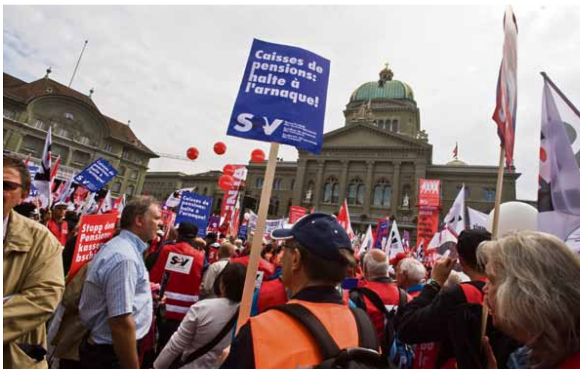
2009: il SEV manifesta sulla piazza federale contro la truffa delle casse pensioni

Proprio in tempi di difficoltà economiche, le prestazioni di questa assicurazione non possono essere ridotte. L'assicurazione di disoccupazione è il paracadute sociale per tutti i lavoratori, che li tranquillizza nel caso dovessero perdere il posto di lavoro. Se non ci fosse, molti lavoratori ridurrebbero massicciamente i loro consumi per in qualche modo prepararsi alle conseguenze di una crisi, che verrebbe però così peggiorata. L'AD deve perciò essere risanata, tramite contributi temporaneamente più alti. Inoltre, il periodo che dà diritto al lavoro a tempo parziale do-